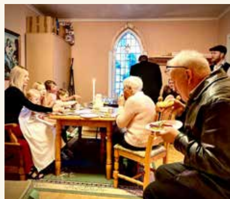
HØYE SNITTER: Familien feiret i dåpssakristiet etterpå.

Til kirken kom foreldre, søsken, oldemor, bestefar og fadderne. Og arbeidskollegene til snekkeren var også